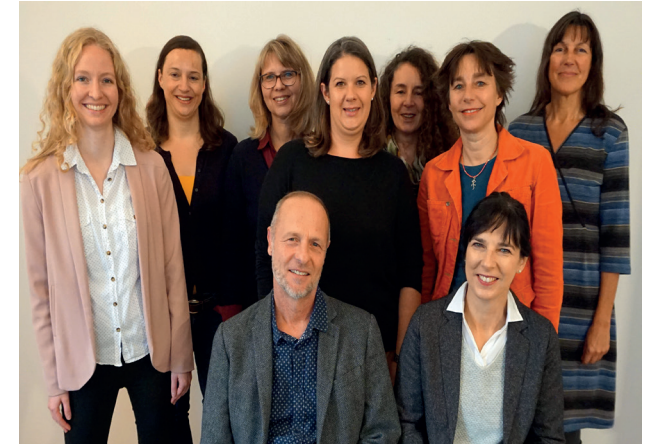
Mitarbeitende des sozialpsychiatrischen Dienstes